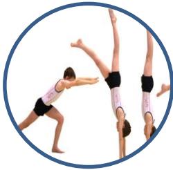
Activités Gymniques Acrobatiques