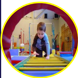
Activités d'Eveil Gymnique pour la Petite Enfance