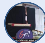
Activités Gymniques Acrobatiques