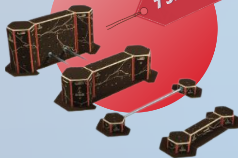
KIT S (Kit d'entraînement) Réf. 00600100

Dans le cadre du partenariat avec le Comité Régional FFGym Nouvelle Aquitaine , une convention a été mise en place avec la société GYMNOVA et les marques BRICK et O'JUMP pour une « opération matériel » sur la gamme Parkour avec une remise exceptionnelle de 30%* sur du matériel neuf pour toute commande passée avant le 30/06/2023.